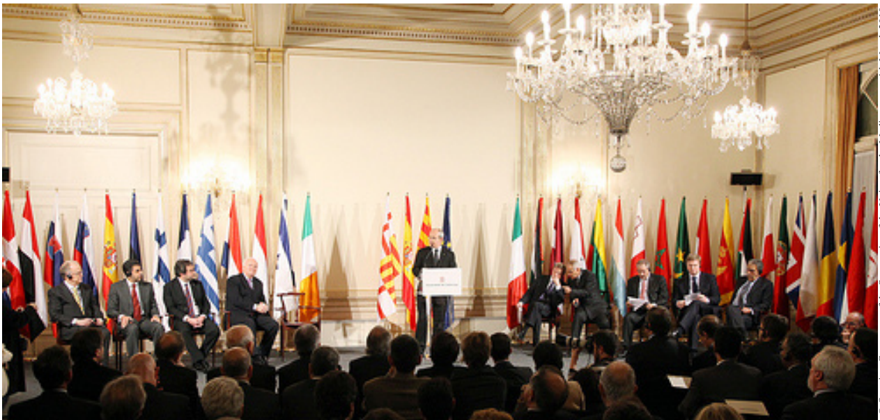
© Opening Ceremony of the Secretariat of the Union for the Mediterranean, 4th March 2010

L'Union pour la Méditerranée (UpM) porté sur les fonds baptismaux en juillet 2008 est une initiative issue du constat de l'insuffisance et des manques des actions de l'Europe vis-à-vis des Etats de la rive sud de la Méditerranée. Après bien des difficultés, liées à son lancement, l'Union semble encore aujourd'hui marquer le pas. Cette note revient ainsi aux origines de l'UpM et évoque son évolution, en passant par les différents blocages qui l'ont jalonnée. Un aperçu des réalisations à mettre à son actif est également fourni. Pour finir la note pose un certain nombre de questions sur l'avenir de l'UpM; notamment celles relatives à la démarche de la France, aux dynamiques propres au conflit israélo-palestinien ou encore à la situation socio-politique actuelle au Moyen-Orient.